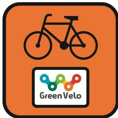
Rysunek 1. Wzór znaku R-4 z kolorowym logo GreenVelo, stosowanym przy znakowaniu trasy głównej.

Projekty pozostałych znaków (R-4b, R-4c, R-4d) z uwagi na swój indywidualny charakter powinny być sporządzone przez projektantów z wykorzystaniem szablonu pola znaku R4, przekazanego w załączeniu.